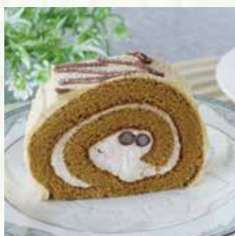
|| 黒蜜きなこのロールケーキ 550 yen