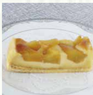
|| りんごのタルト 550 yen