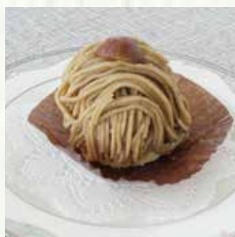
|| 渋皮栗のモンブラン 550 yen