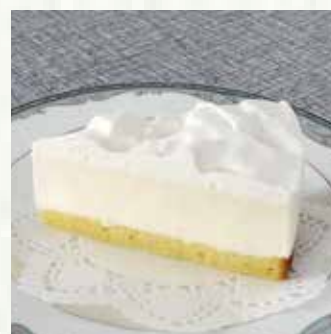
|| レアチーズケーキ 550 yen