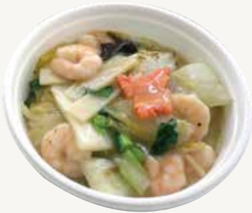
海老入りあんかけ