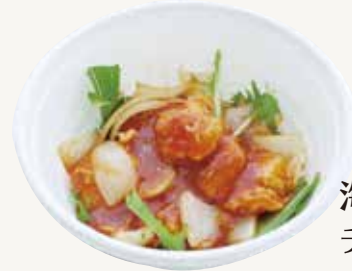
海老の チリソース