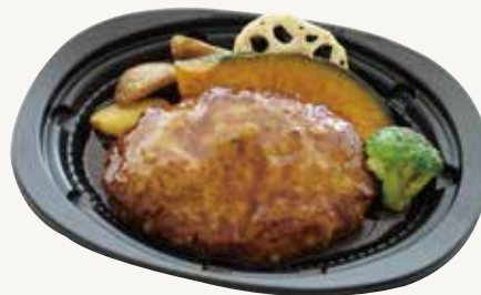
ハンバーグステーキ