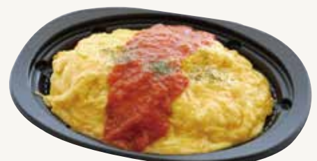
チキンオープンオムライス