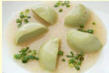
19. 抹茶豆腐の蒸し物 蟹あんかけ