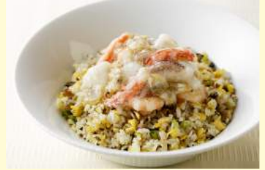
12. 海鮮あんかけ炒飯