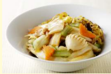
11. 五目あんかけ 焼きそば