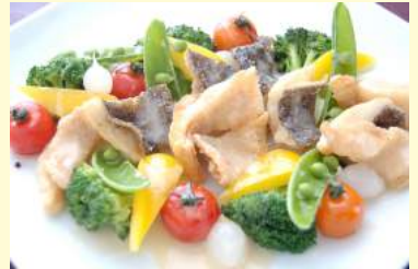
16. カレイのフリット バーニャカウダソース