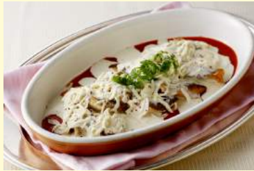
5. 白身魚のポワレ オニオンクリームソース