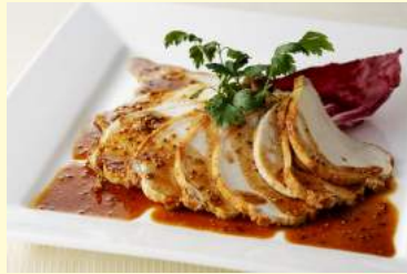
6. ローストポーク 粒マスタードソース