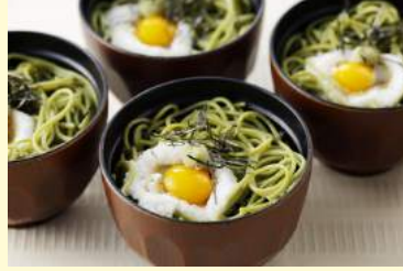
3. とろろとうずらの わんこそば