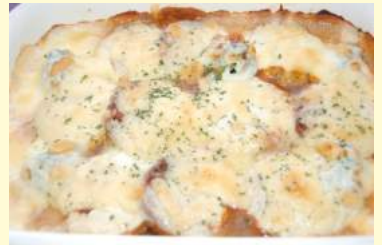
20. 煮込みハンバーグ のグラタン