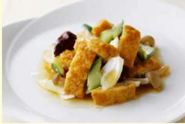
9. 白身魚の甘辛炒め