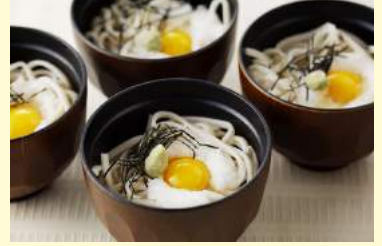
4. とろろとうずらの わんこうどん