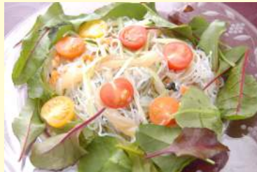
14. クラゲと 春雨の和えサラダ