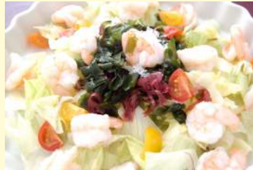
15. 海藻シュリンプ サラダ