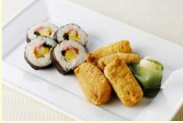
1. 太巻き&いなり寿司