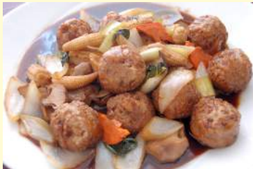
17. 粗挽き肉団子の 黒酢炒め