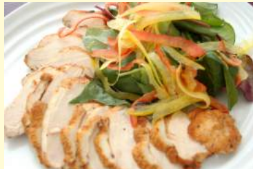
18. 鳥胸肉のスパイス ローストサラダ仕立て