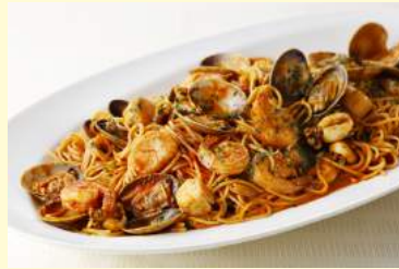
7. シーフードトマト スパゲッティ